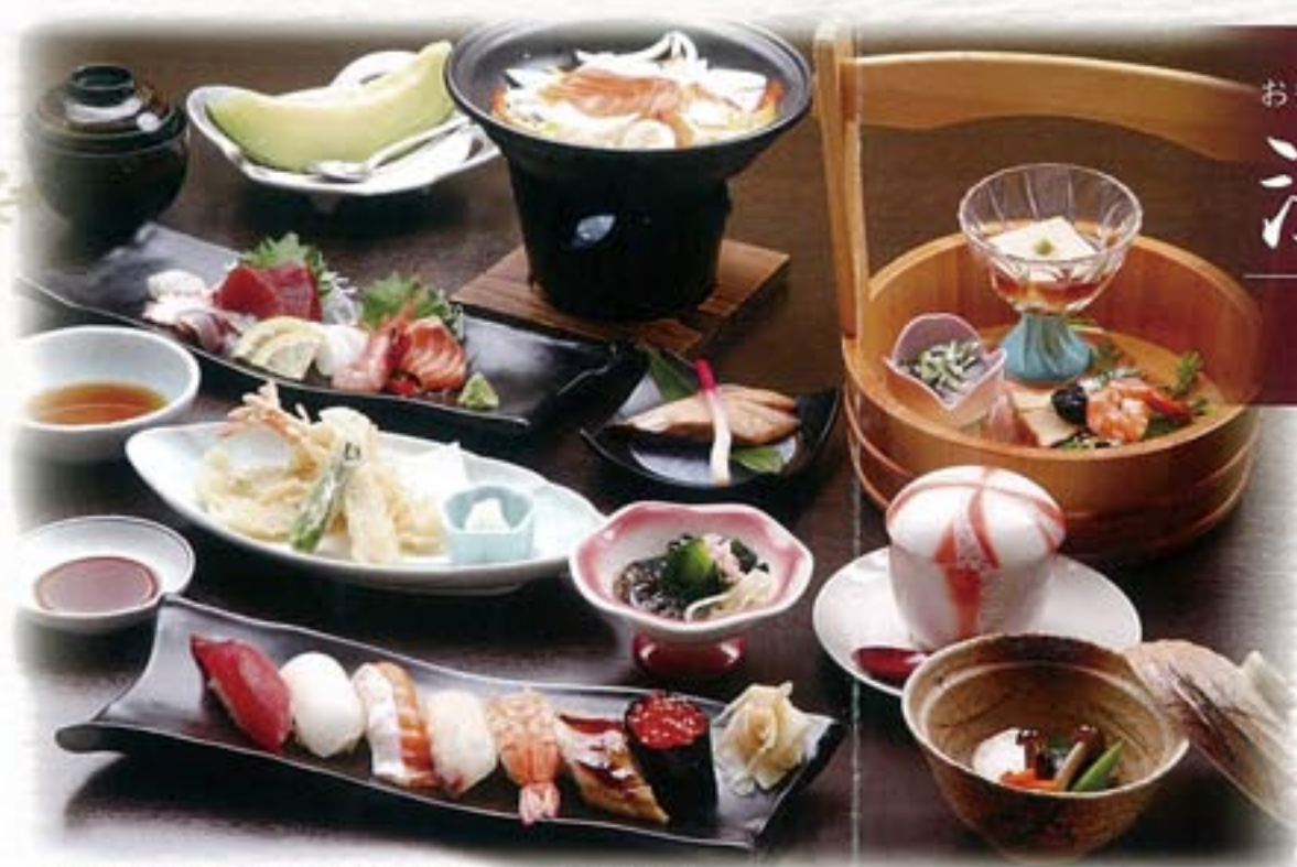
写真は5,000円コース ※メニューは食材により多少変更があります。

最大40名様の大広間をはじめ、人数に合わせてご利用いただける様々なテーブルをご用意しております。 まるい家こだわりの料理と真心込めたサービスで、ご家族・ご親戚・ご友人が集う大切なお席をおもてないたします。