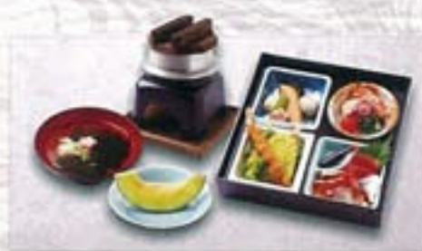
お子様用釜めし膳 2,650円

・特選握り寿司7貫・八寸・お造り・酢の物・焼物・揚物 ・煮物・茶碗蒸し・汁物・甘味物