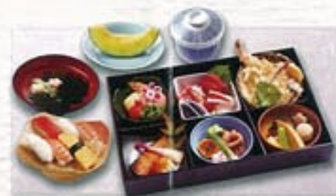
寿司付き和正膳 4,000円

・特選握り寿司7貫・八寸・お造り・酢の物・焼物・揚物 ・煮物・茶碗蒸し・汁物・甘味物